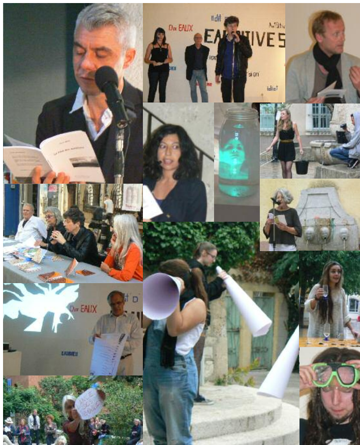
de gauche à droite et de haut en bas